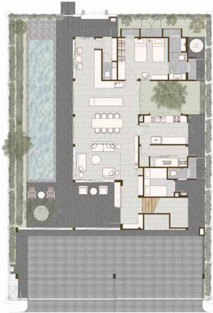
1 st Floor Plan