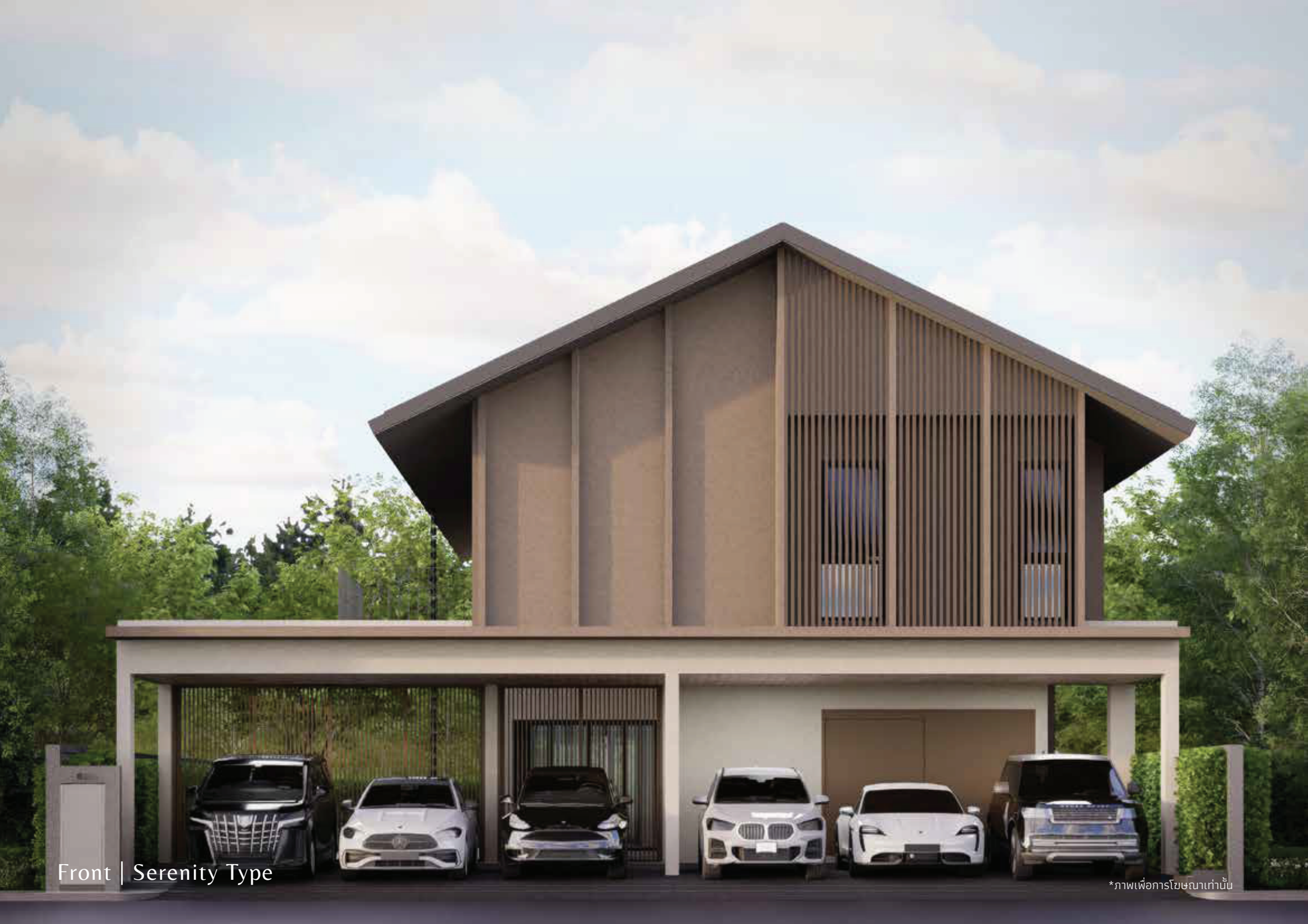
Front | Serenity Type