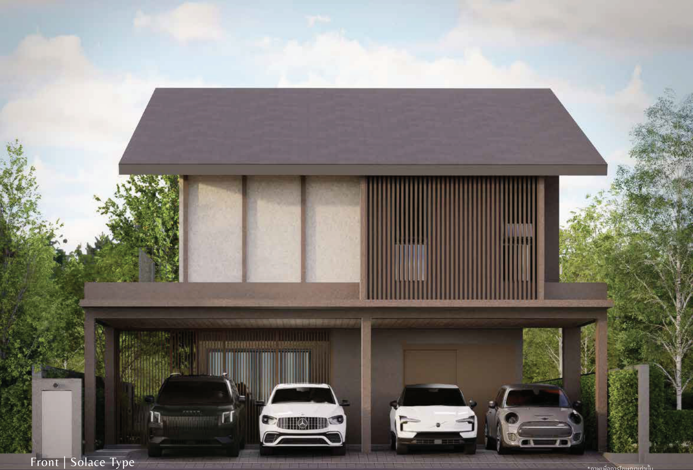
Front | Solace Type