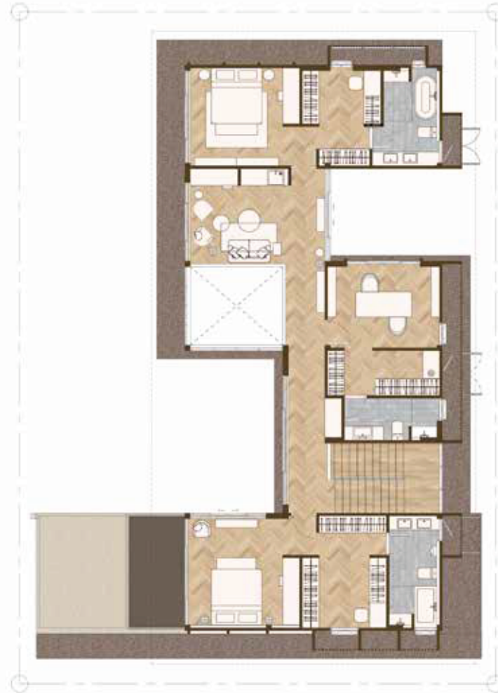
2 nd Floor Plan