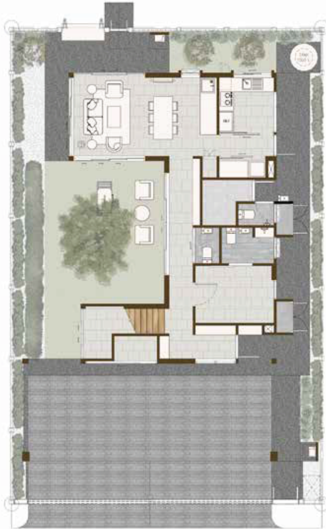
1 st Floor Plan