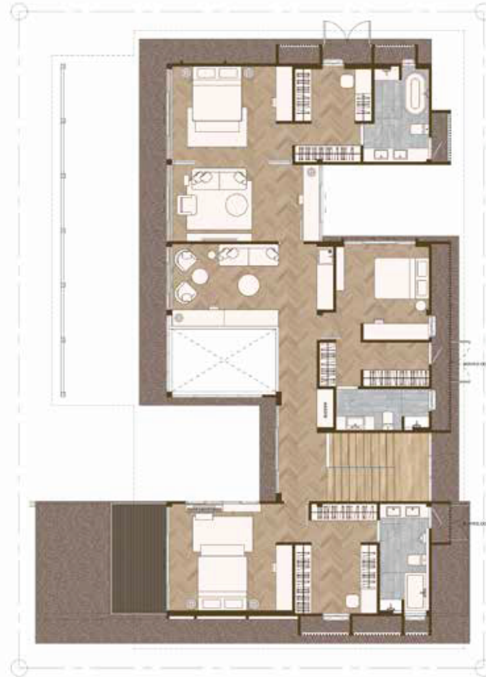
2 nd Floor Plan