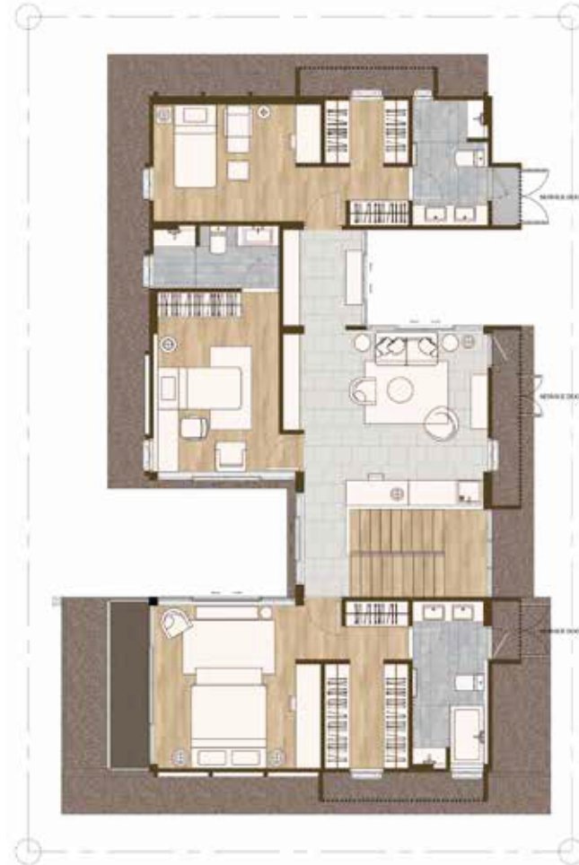
2 nd Floor Plan