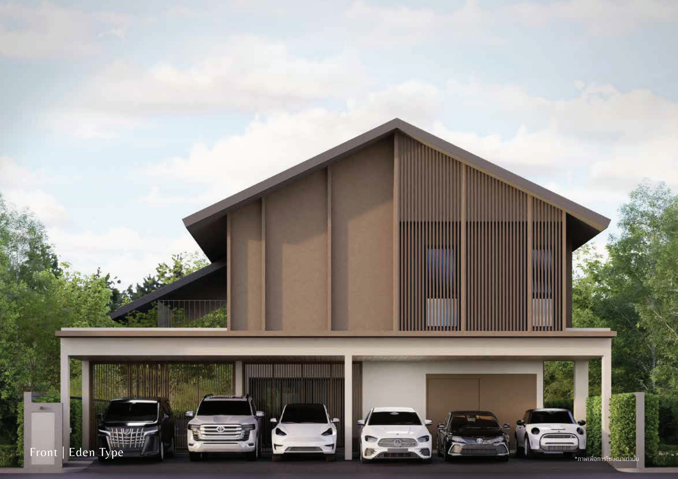
Front | Eden Type