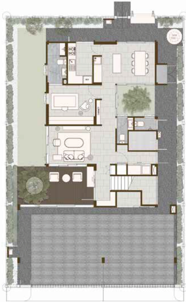
1 st Floor Plan