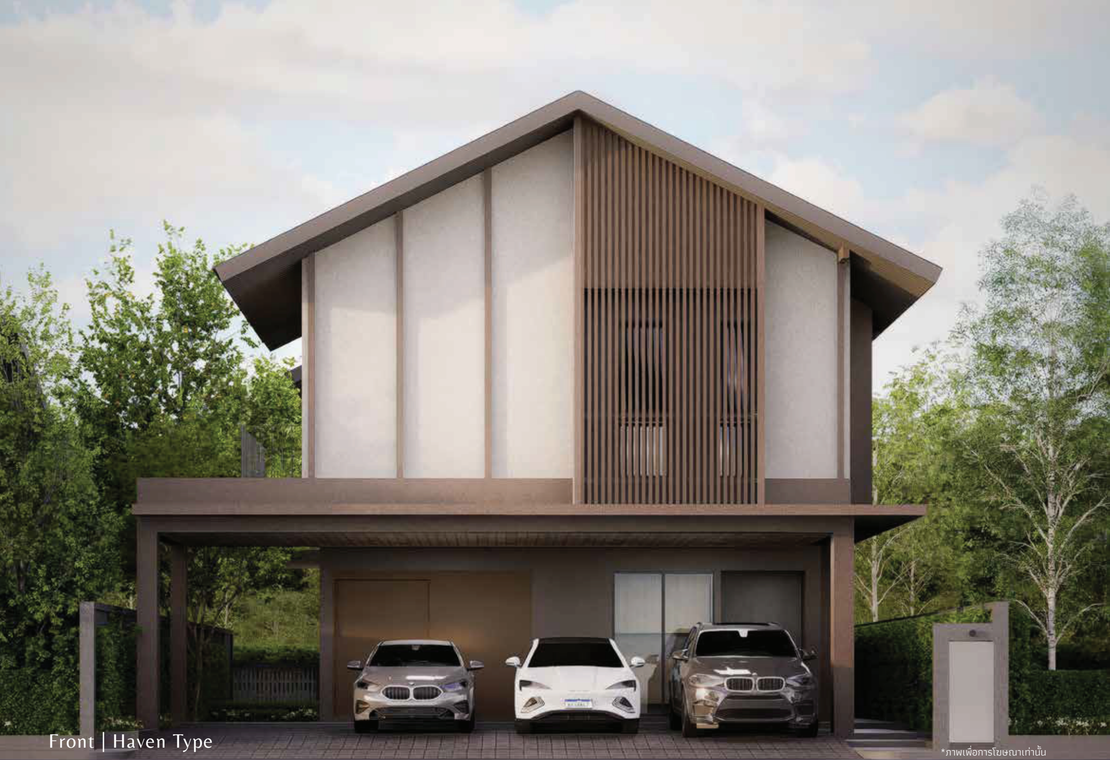
Front | Haven Type