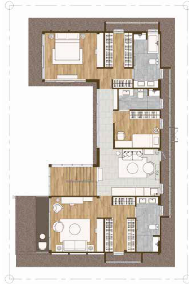
2 nd Floor Plan