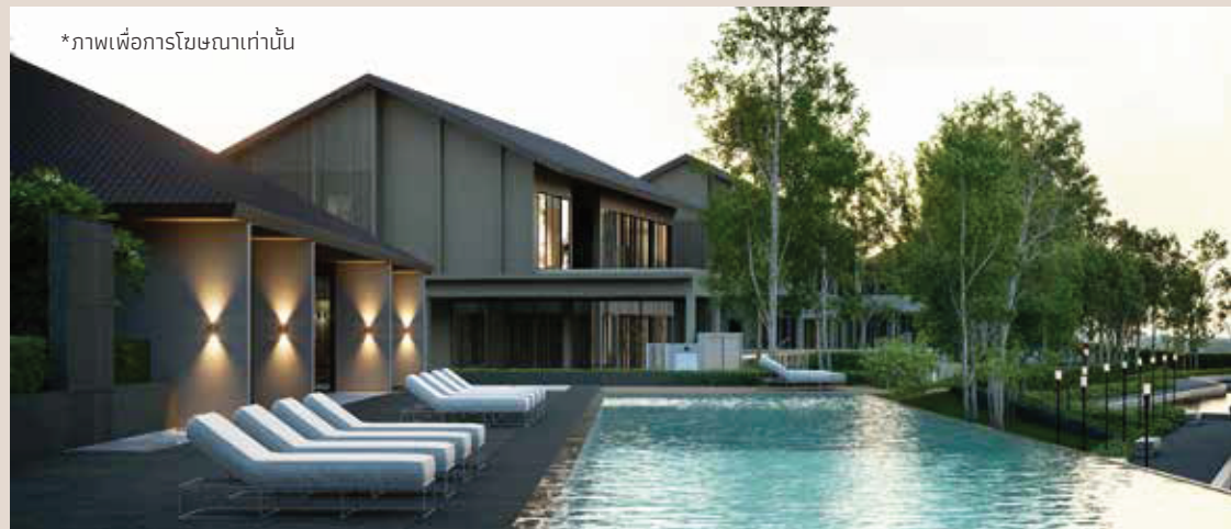
*ภาพเพื่อการโฆษณาเท่านั้น