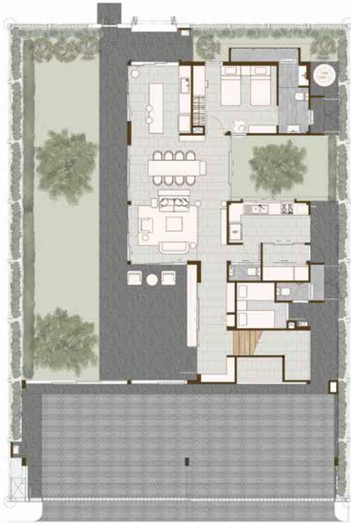
1 st Floor Plan